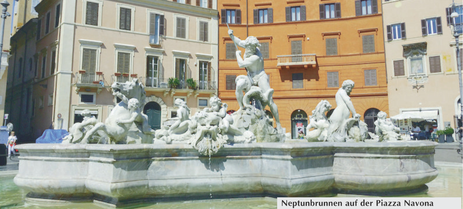
Neptunbrunnen auf der Piazza Navona